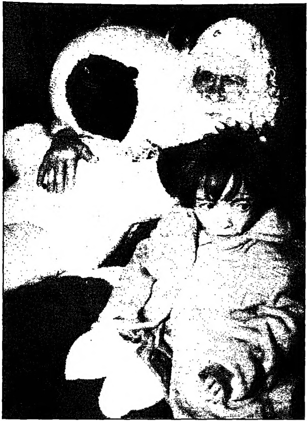
بابا نويل الذي وصل حاملا هداياها من إسبانيا يدايم طفلًا عراقيا مصابا بسوء التغذية